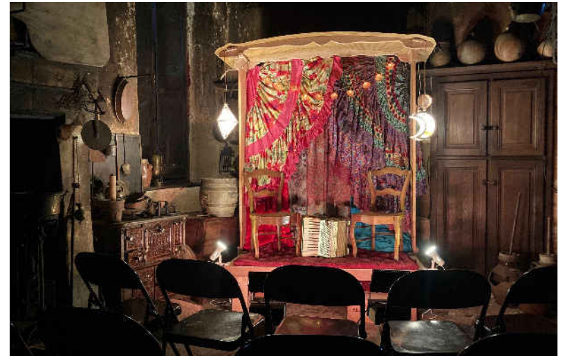
Le chemin du soleil – 2022 – CRAC de Fontenoy