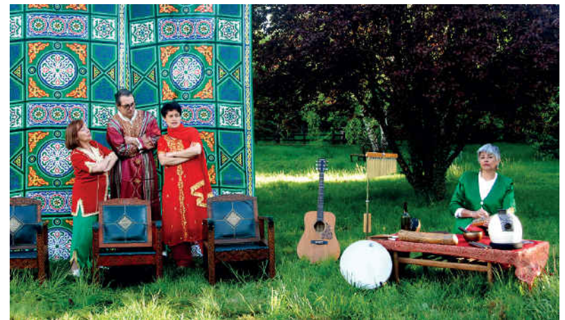
Contes des sages soufis – 2021 – Premier Baiser